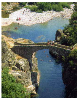
Le Pont du Diable Theueyts

Piscine profondeur maxi 1m40. Pataugeoire de 6m x 2m50 profondeur 0m40 pour les enfants de moins de 6 ans. Eau contrôlée, filtrée et traitée. L'ensemble est clos.