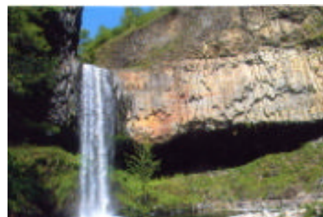
Cascade de Pourcheyrolles et sa coulée basaltique