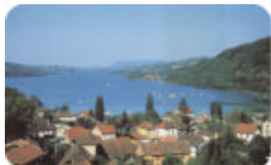
Vue générale de Charavines

En plein coeur du pays Voironnais, le village de Charavines (500mètres d'altitude) est niché au creux des collines, au bord du lac de Paladru (5 ème lac naturel de France), avec en toile de fond un massif préalpin sauvage et grandiose : La Chartreuse. A moins d'une heure de Lyon, Grenoble ou Chambéry, cette région est riche en activités sportives, culturelles et touristiques quelle que soit la saison.